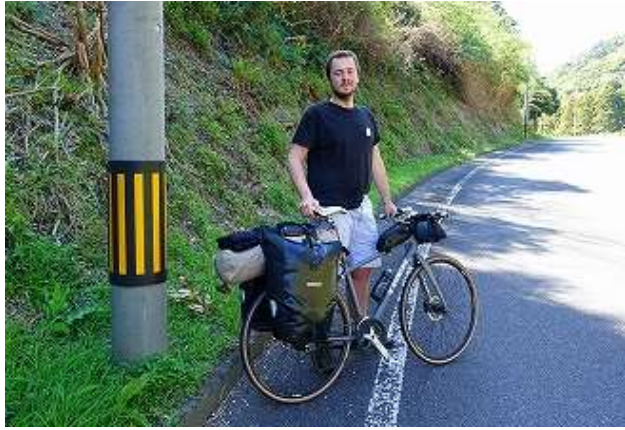
フランス人/ブラジーンさん