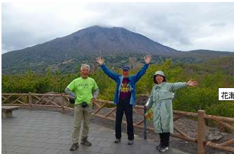
花瀬自然公園/溶結凝灰岩の石畳