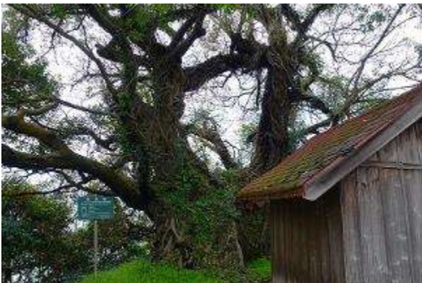
桜島・樹齢 1000 年のアコウ

佐多岬の巨大なガジュマルはいかにも南国らしく存在感があった。またキイロノウゼンも花の少ない時期に目を引いた。