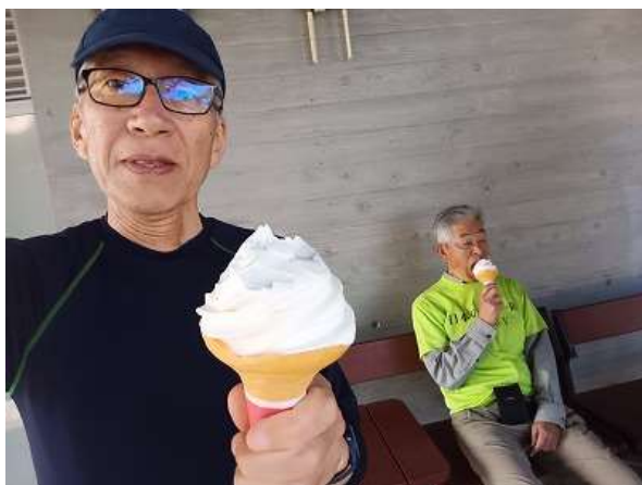
佐多岬灯台を眺めながら、今日のご褒美のソフトクリームを食べる