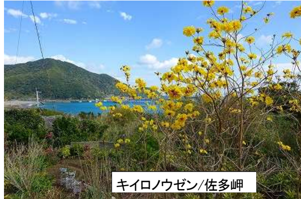
キイロノウゼン/佐多岬