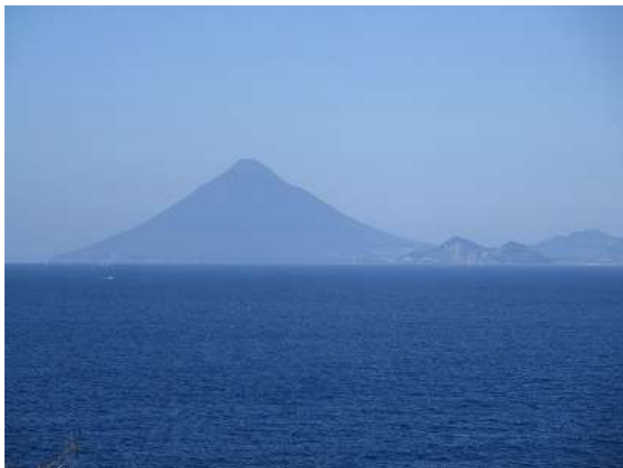
開聞岳が近くに見える