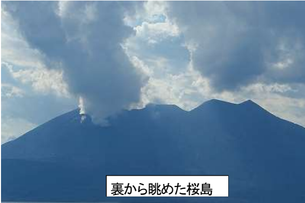
裏から眺めた桜島