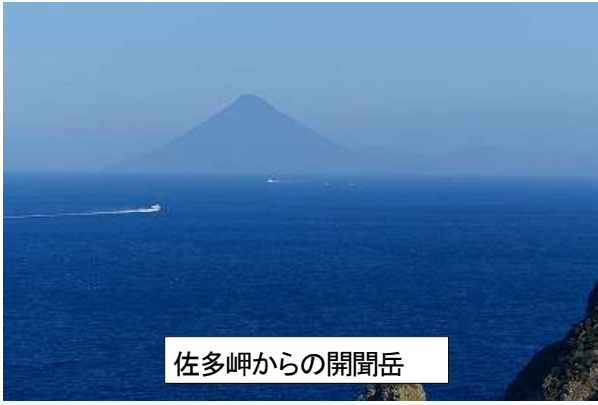
佐多岬からの開聞岳