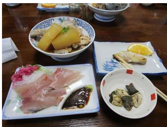
取れたての魚、カンパチの刺身、アラ煮などを食する フィリピン人の女将と、いろいろと話す