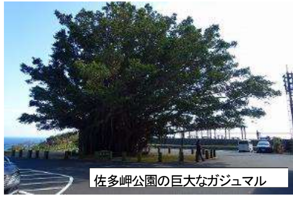
佐多岬公園の巨大なガジュマル