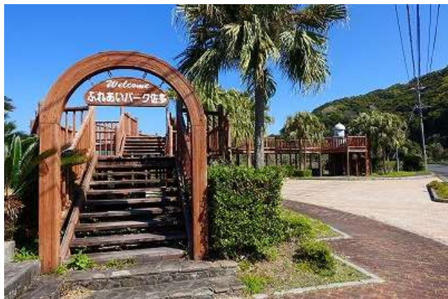
ふれあいパーク佐多のデッキからの、開聞岳が見事

11:30 フラン人ブラジャーノと出会う。自転車で3か月かけて日本を回るとのこと。